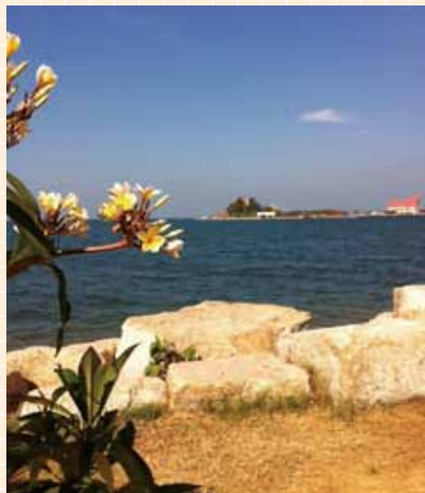
海の向こうに見えるのは「ロイ島」です。栈橋が架かっているんで歩いて渡れます。

私が今住んでいるのは、バンコクの東南、車で約1時間半のシーラチャーという海辺の田舎町です。 (日本人的にはシラチャ、タイ語の発音はシーラチャーと伸ばします) その昔、シーラチャーは小さな漁村だったものが、周辺の工業団地開発に伴い多くの日系企業が進出し、日本人駐在員が多く住むようになりました。 2009年に日本人学校が設立されてからは帯同家族も増え、シーラチャーに住む日本人は年々増加傾向です。 現時点では、シーラチャーの町は5,000人以上の日本人が住んでいると言われていますが、長期・短期出張者を含めるともっと多いかも知れません。 ある資料によると、シーラチャーの人口は約23万人です。市街中心地となると5万人程度だと思われるので、日本人の比率、密集度は相当高いです。 1年前は4,000人と言われていたんで、1年で増加率は25%と驚異的です。 洪水リスク回避のため、東南地域が注目されていることも日本人増加に拍車をかけるでしょう。 そういうわけで、石を投げると日本人に当たるシーラチャーは日本料理屋や日式のスナック、カラオケも多く、日本人にとっては住みやすい環境になりました。 とはいっても、大都会バンコクのように何でもあるわけでもないんで、週末の娯楽はゴルフや釣りぐらいでしょうか?ゴルフも釣りもやらない人は時間を持て余して結構大変かも知れませんね。 さすがに昼間はカラオケはやってませんし・・・(笑)